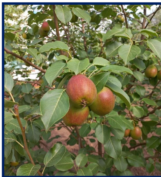
Поспевают яблоки и груши...