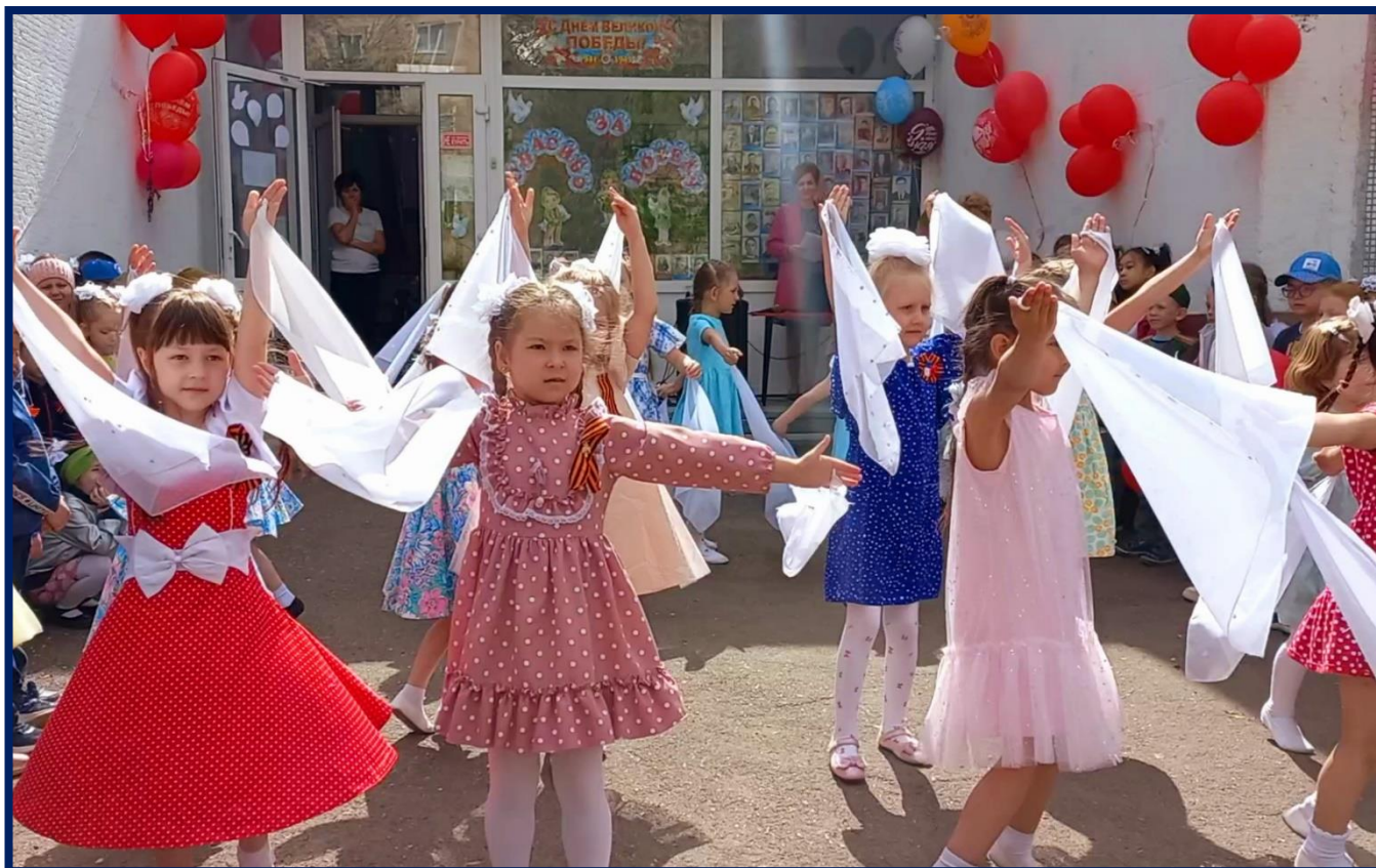
Летит, летит по небу клин усталый...