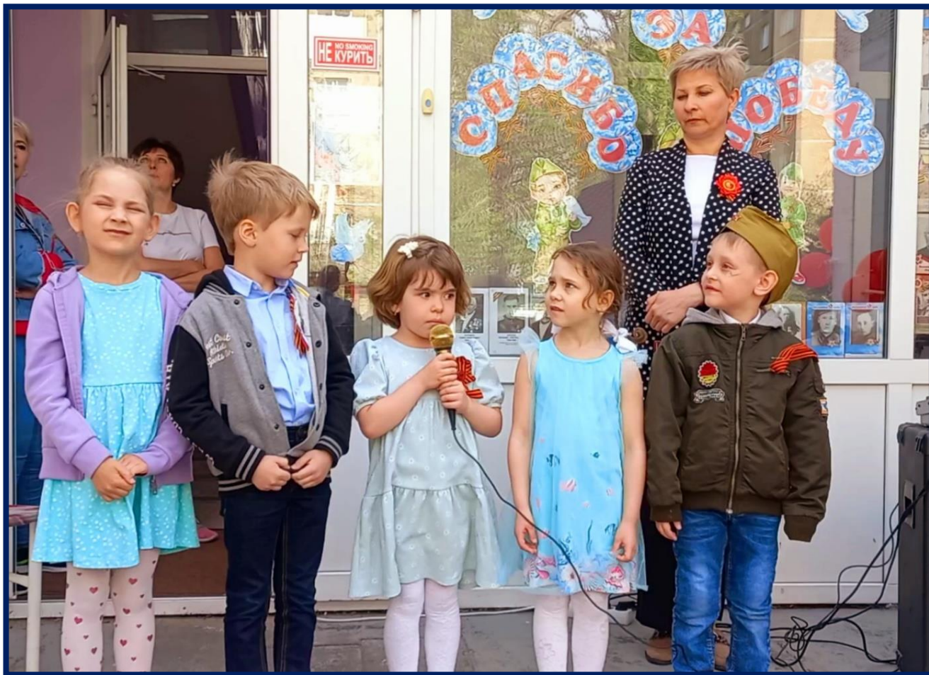
Победа в сердце каждого ребенка...