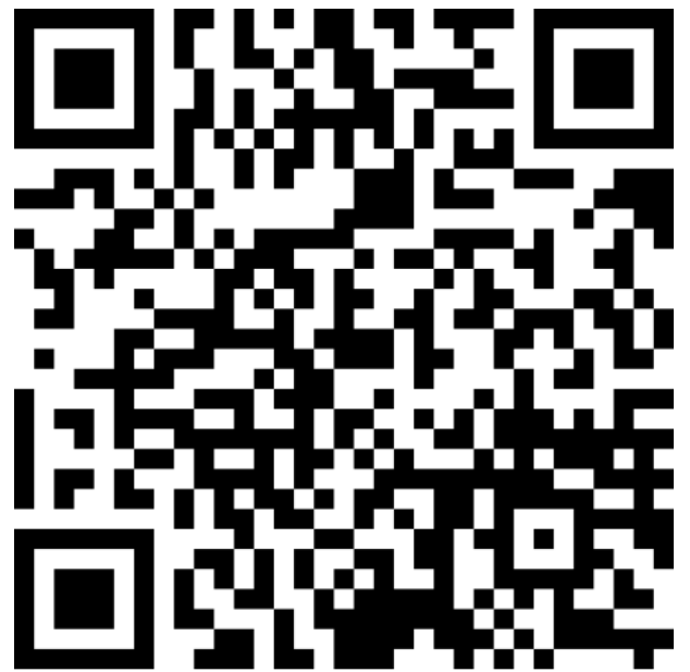
День государственного флага РФ